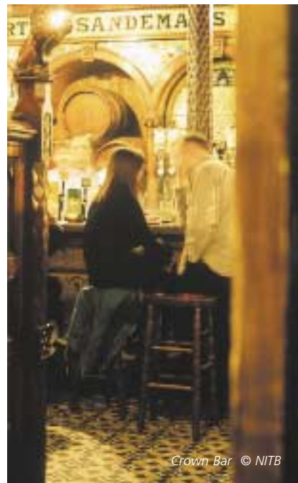
Crown Bar

Beim Ardoyne Street Festival, wenn im republikanisch geprägten Nordbelfast die Wolfe Tones' „Lets Join the IRA“ in den Nachthimmel singen und Kinder mit ihren Eltern zusammen in die grün/weiß/orange Flagge der Republik gehüllt lautstark mitsingen, erscheint die Gewalt wieder erschreckend nahe.