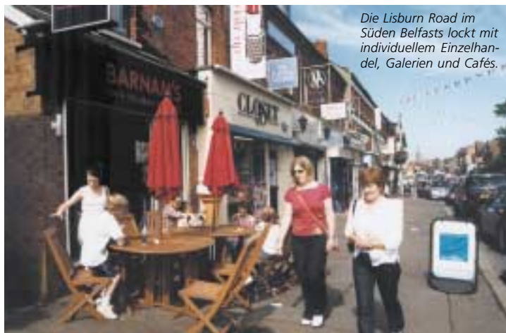
Die Lisburn Road im Süden Belfasts lockt mit individuellem Einzelhandel, Galerien und Cafés.