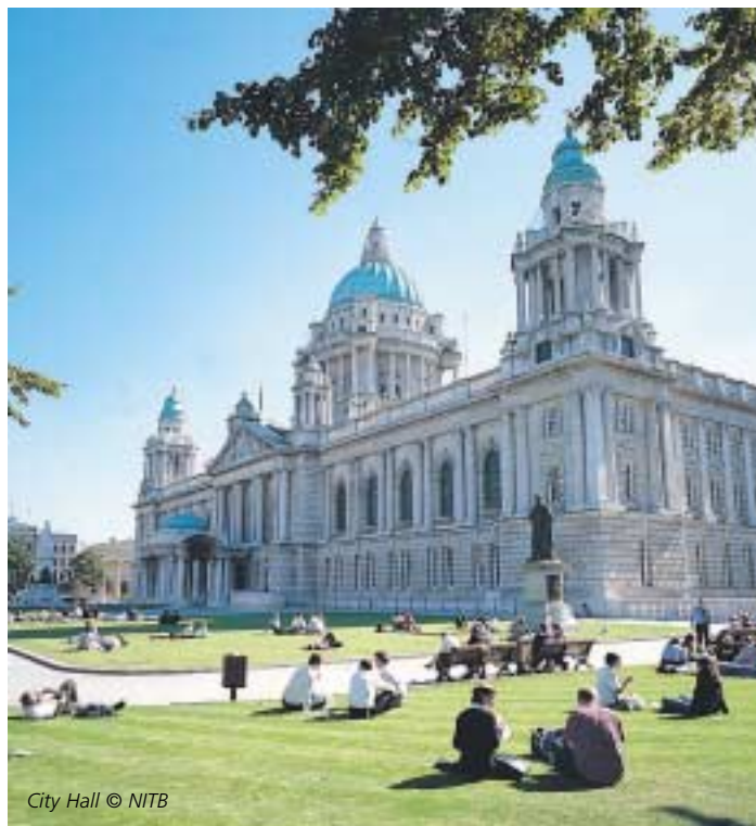
City Hall