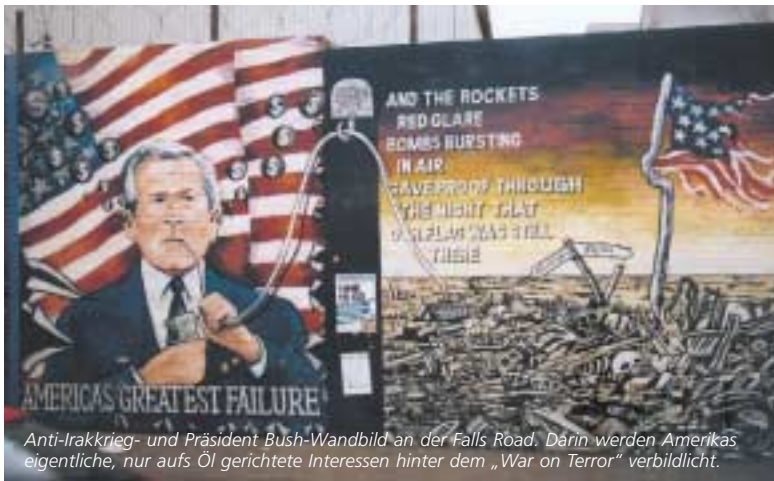
Anti-Irakrieg- und Präsident Bush-Wandbild an der Falls Road. Darin werden Amerikas eigentliche, nur aufs Öl gerichtete Interessen hinter dem „War on Terror“ verbildlicht.