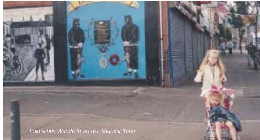
Politisches Wandbild an der Shankill Road

Mitte: Beim Marsch zum 25. Jahrestages des Hungerstreiks trugen einige Marschierende die „Kleidung“ der Streikenden, nämlich Gefängnisdecken. Damit protestierten diese dagegen, die übliche Sträflingskleidung der Kriminellen tragen zu müssen und insgesamt dieselbe Behandlung wie Kriminelle zu erhalten. Stattdessen forderten die Hungerstreikenden einen Sonderstatus als politische Häftlinge.