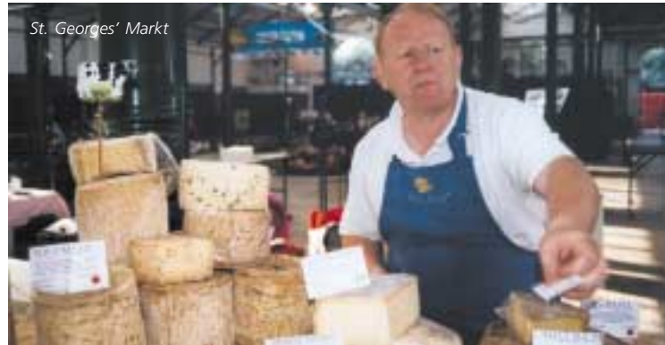
St. Georges' Markt