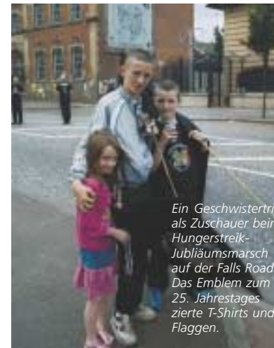
Ein Geschwistertrio als Zuschauer beim Hungerstreik-Jubiläumsmarsch auf der Falls Road. Das Emblem zum 25. Jahrestages zierte T-Shirts und Flaggen.

billiger als Dublin, aber ebenso vital und immerhin auch eine Hauptstadt, meint John. Außerdem darf man rauchen in den Pubs und Clubs, das sei irgendwie wie früher zu Hause. Siobhan aus Belfast lobt, ihre Heimat sei mittlerweile ebenso kosmopolitisch wie jede andere europäische Großstadt. Laut Statistik bilden die Chinesen in Nordirland die größte ethnische Minderheit. In Belfast macht sich dies allerdings nicht bemerkbar, keine Chinatown weit und breit. Auch hinter den Treisen und im Servicebereich der