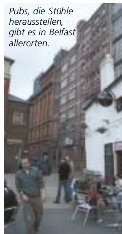
Pubs, die Stühle herausstellen, gibt es in Belfast allerorten.