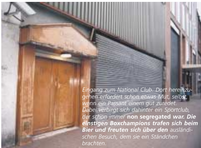
Eingang zum National Club. Dort hereinzu- gehen erfordert schon etwas Mut, selbst, wenn ein Passant einem gut zuredet. Dabei verbirgt sich dahinter ein Sportclub, der schon immer non segregated war. Die einstigen Boxchampions trafen sich beim Bier und freuten sich über den ausländischen Besuch, dem sie ein Ständchen brachten.