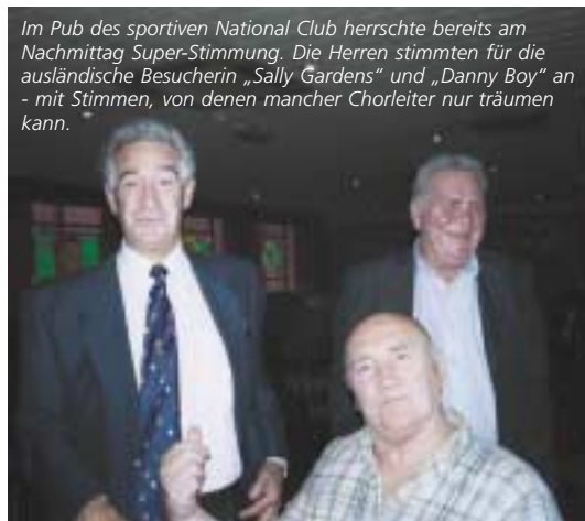
Im Pub des sportiven National Club herrschte bereits am Nachmittag Super-Stimmung. Die Herren stimmten für die ausländische Besucherin „Sally Gardens“ und „Danny Boy“ an - mit Stimmen, von denen mancher Chorleiter nur träumen kann.