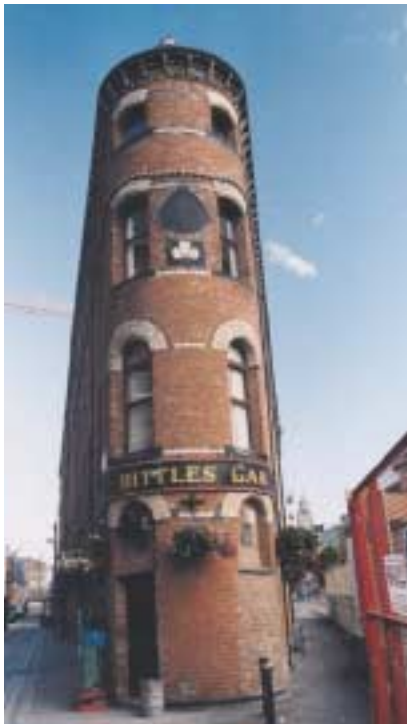
Baustellen gibt es in Belfast allerorten, so dass die schönen viktorianischen Gebäude mitunter ganz bedrängt wirken.