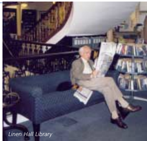
Linen Hall Library