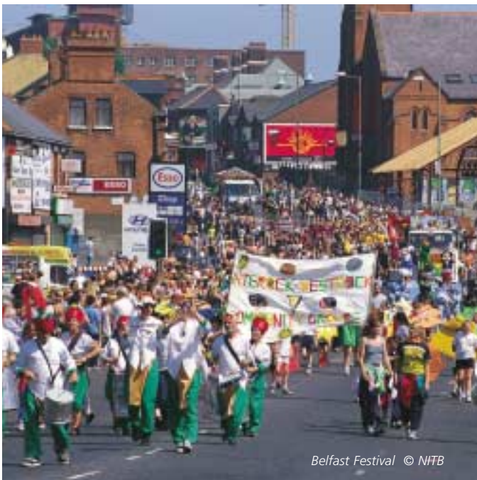
Belfast Festival

treiben, oder im Crescent Arts Centre, in dem auf mehreren Etagen die Fendersky Gallery des Iraners Jamshid Mirfenderesky residiert, in der zeitgenössischen Kunstszene trifft man die üblichen Verdächtigen an, Weltenbummler aus aller Herren Länder. Ein Ort der Kunst, an dem Kunsthandwerk, aber auch zeitgemäße Malerei, Fotografie und Skulptur verkauft wird, ist die Space Gallery in der Conway Mill. Sie nutzt weiträumige Säle in einer der ehemaligen Flachs-Spinnereien, die den Westbelfastern einst Lohn und Brot bescherten und deren Schließungen in den 1960er Jahren mit für den Ausbruch des Bürgerkrieges verantwortlich waren. Neben der Galerie sind in dem Gebäude auch Werkstätten und Ateliers untergebracht, sodass man hier an Türen klopfen und direkte Kontakte zu den Künstlern knüpfen kann. Hier ist der konfessionelle und politische Hintergrund erneut kein Thema. Stattdessen höre ich von zahlreichen community projects, wo es gilt, Kindern oder älteren Betroffenen mit Kunst Perspektiven zu eröffnen. Auf dass die Entdeckung und Aktivierung der eigenen Potentiale sie von der Gewalt fernzuhalten hilft.