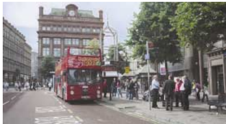
Rote Doppeldecker fahren Touristen durch die Stadt auf Sight-Seeing Tours. Dabei lässt sich Belfast wunderbar erlaufen, so klein und übersichtlich ist die Stadt am Fluss Lagan. Außerdem hat man dann Gelegenheit, mit den Belfastern in Gespräch zu kommen. Denn die stehen immer wieder in Grüppchen beim Plaudern zusammen und fordern die vorbeistreunende Touristin schlagfertig und charmant zum Mitreden auf. So viele Lebensgeschichten, wie man da zu hören kriegt, warmherzig und offen erzählt, kann man gar nicht alle weitergeben.

der Colaflasche, in der Poiti eingeschmuggelt wurde, besie gelt wird. Bevor sich da Straßenfest auflöst und die üblichen Pubrangeleien zu bedrohlichen Schlägereien ausarten, sollte ich bereits auf dem Weg zurück zum Hotel sein, so raten mir die Belfasters. Angesichts der vielen kleinen Kinder, deren übergroß geratenen Fußballtrikots im kalten Wind flattern, ist eine Eskalation eigentlich nicht vorstellbar. So ist es keineswegs die Angst vor Randalen, die mich zurück in die Innenstadt treibt, sondern die Menge an Eindrücken, die mich ganz erfüllt und ein wenig erschlagen mein Hotel aufsuchen lässt. Dort angekommen, erscheint das unbeschwerte Treiben in dieser verrückt lebendigen Stadt und das Feiern in den kolonialen Palästen zunächst fast unreal. Doch tun wir es den Belfastern gleich, frei nach dem Motto: das Empire ist tot. Erlebe das Empire!