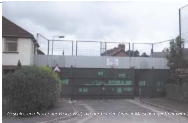
Geschlossene Pforte der Peace-Wall, die nur bei den Oranier-Märschen geöffnet wird.