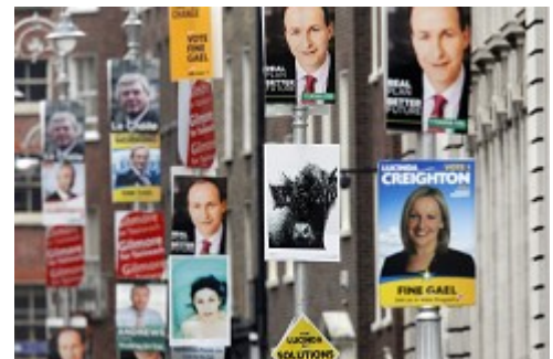
566 Kandidaten für die 166 zu vergebenden Mandate im Dáil

Für Fianna Fáil und für die Grünen drohte die Auszählung der Stimmen (die sich wegen des komplizierten Auszählungsverfahrens über mehrere Tage hinzieht) ein ziemlich qualvoller Prozess werden. Fianna Fáil, seit 1997 ununterbrochen an der Regierung (die Partei hat seit 1932 immer die stärkste Fraktion im Dáil gestellt), musste sich auf das schlechteste Ergebnis der Parteigeschichte gefasst machen, und für die Grünen stand sogar die Existenz als parlamentarische Partei auf der Kippe.